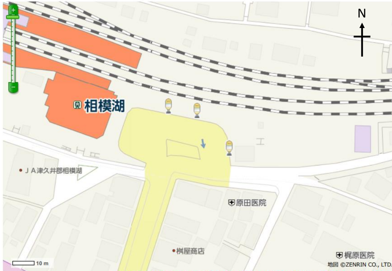
「相模湖駅」バス停地図

※停留所につきましては、走行環境等により、停留所位置を変更し運行している場合もあります。予め承願います。